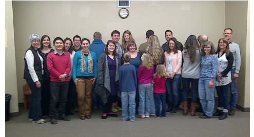
2017년 2월 언어.문화 습득 훈련에 참석한 선교사들과 함께

3월에는 아내와 함께 50대 부부를 대상으로 부부캠프를 인도했는데 짧은 1박 2일의 시간이었지만 참가자들과 함께 웃음과